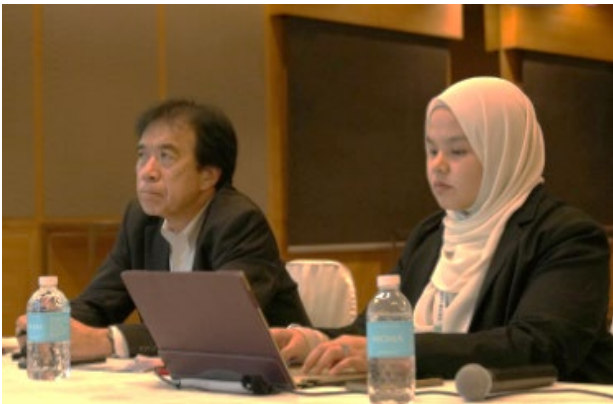
ビジネスエキスパートセッションの司会