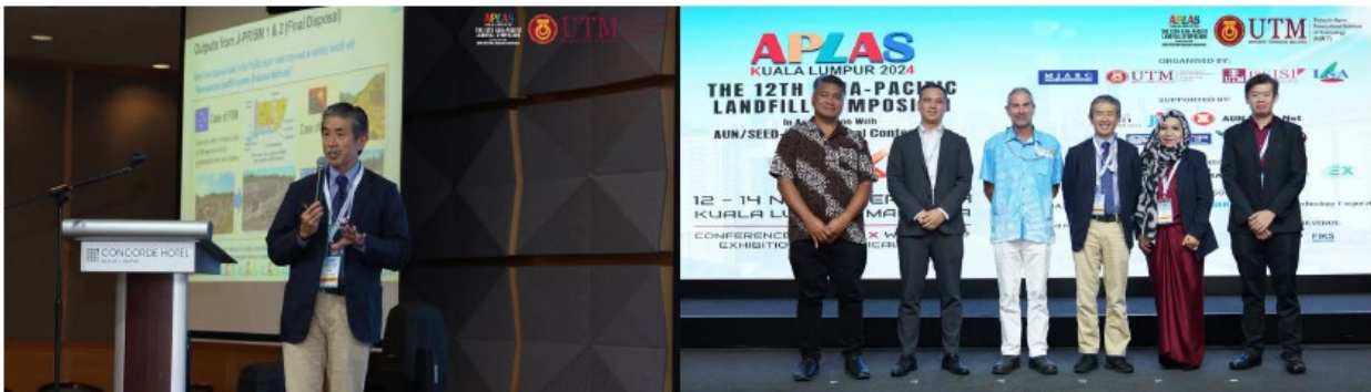
パラレルセッション 6 – Island Waste Management