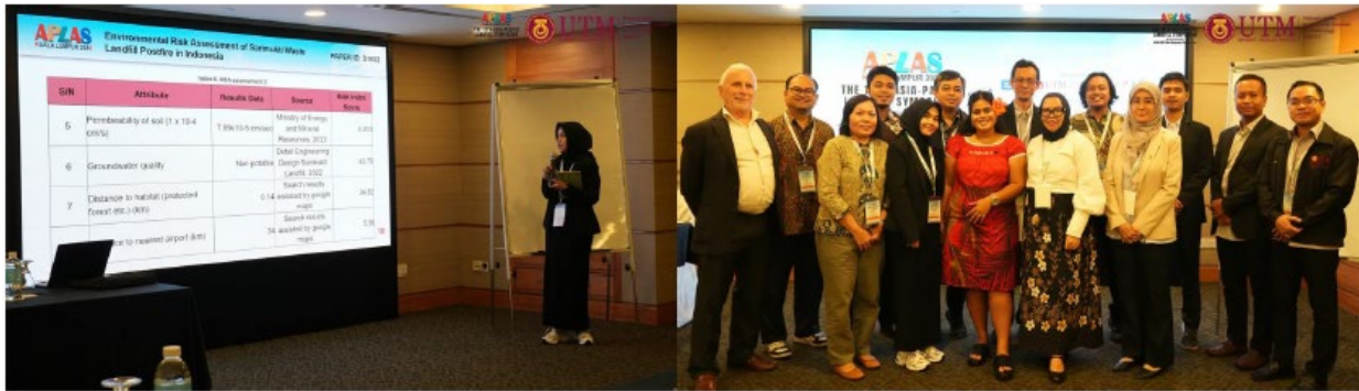
パラレルセッション 7 – Environmental Assesment in Waste Management