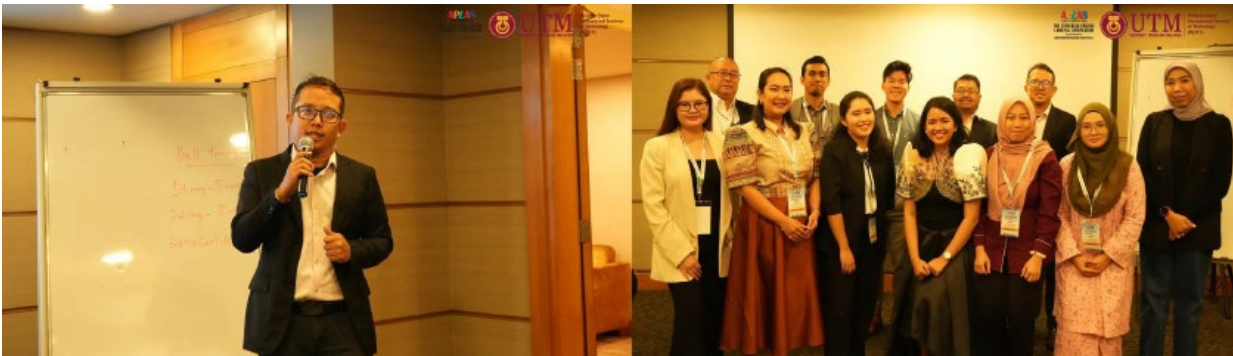
パラレルセッション 8 – Community-Based Waste Management