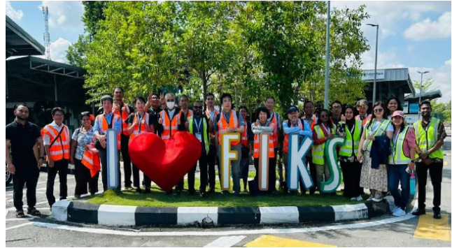
Visit to Fasiliti Inovasi Kitar Semula (FIKS)