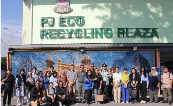
Visit to PJ Eco Recycling Plaza

B: Fasiliti Inovasi Kitar Semula (FIKS), Putrajaya