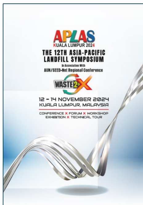
APLAS 2024 プログラム E-ブック