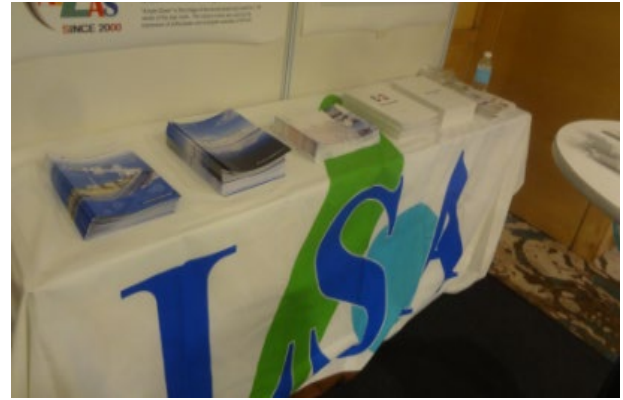
企業展示のパンフレット