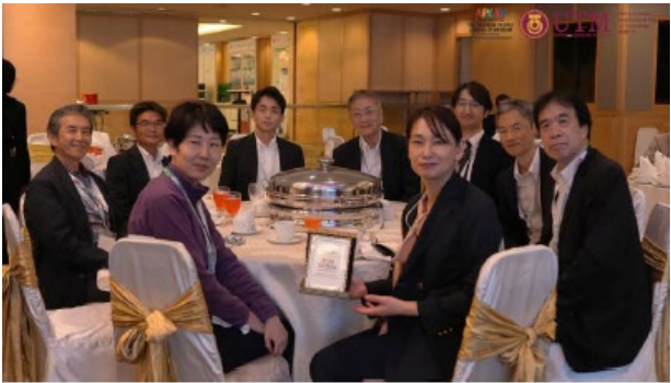
ウェルカムディナー