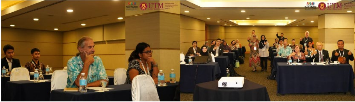
パラレルセッション 2 – Circular Economy in Waste Management