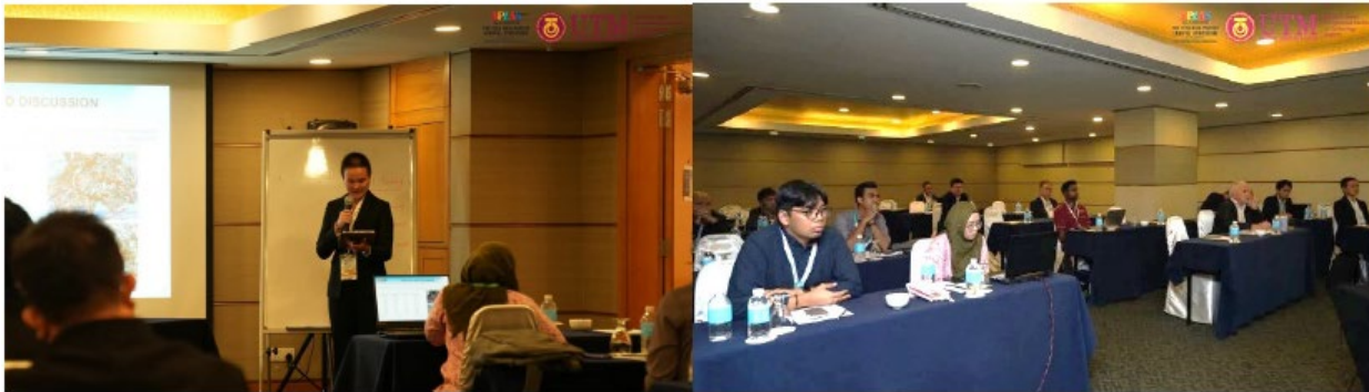
パラレルセッション 3 – Innovative Approach to Sustainable Landfilling