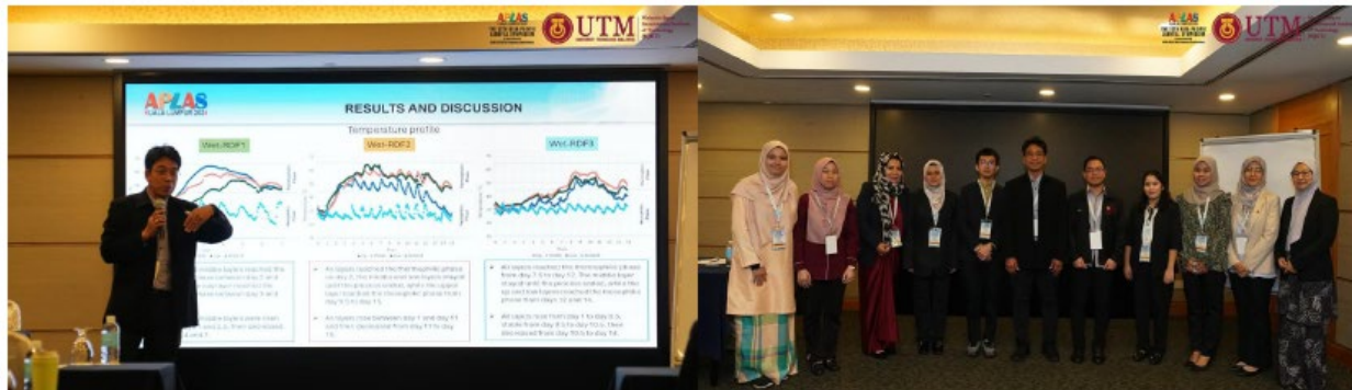
パラレルセッション 4 – Waste Transformation and Valorization Technologies