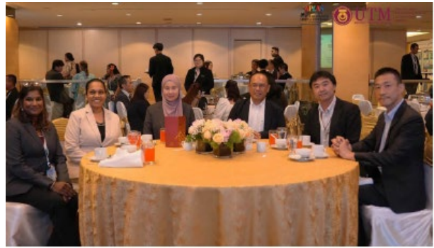
ウェルカムディナー