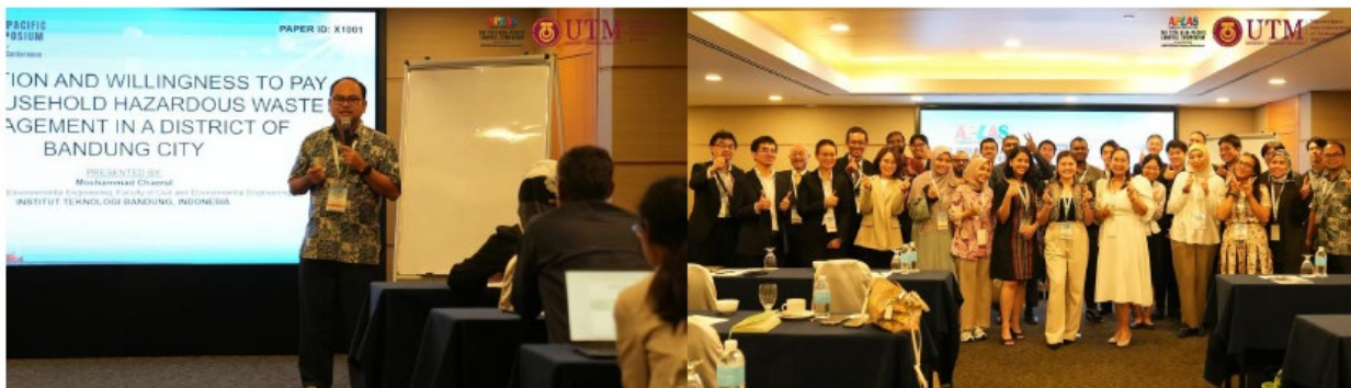
パラレルセッション 1 - Sustainable Waste Management Strategies

2 日間にわたり、8 つのテーマ別セッションが開催され、開催国および海外からの研究者、技術者、学生が参加し、計 43 本の論文が発表されました。