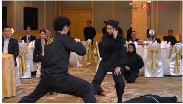
MJIIT の学生によるシラットの演武