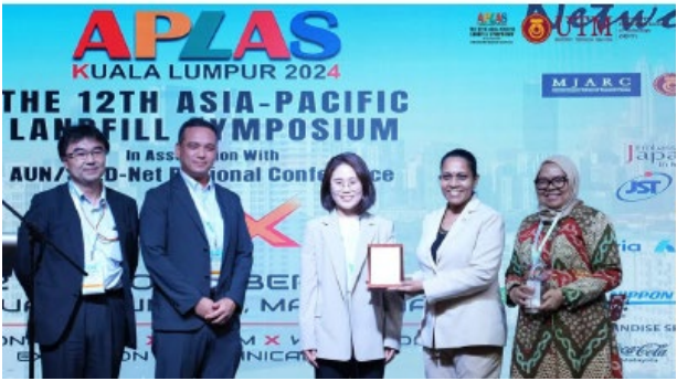
ウェルカムディナー