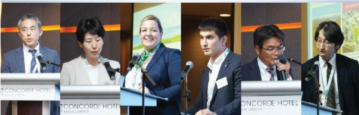
ビジネスエキスパートセッションのプレゼンター