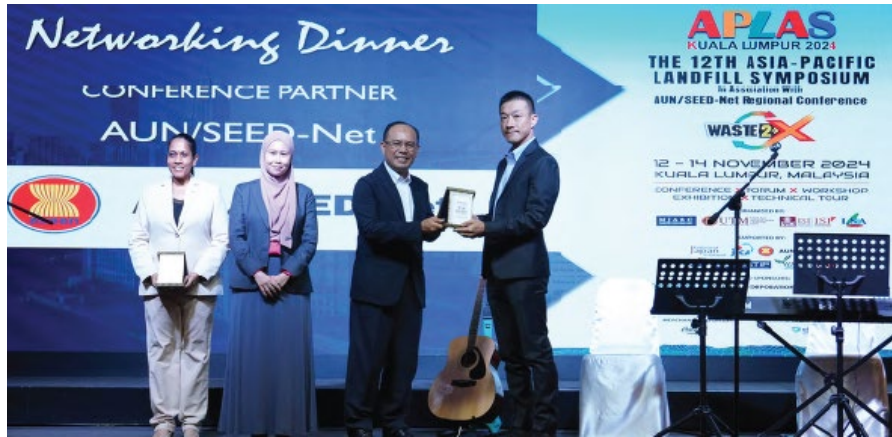
ウェルカムディナー